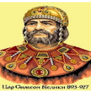
Цар Симеон I 893-927

Началото води цар Симеон I, които бил на власт до 927 година и посветил живота си в създаване на много книжовни школи, изградил черкви и дворци.